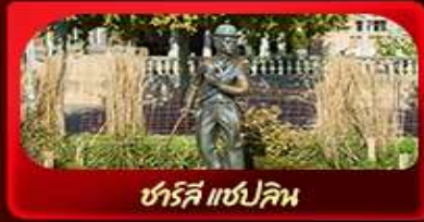
ชาร์ลี แชปลิน