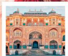
♥♥♥ Amber Fort