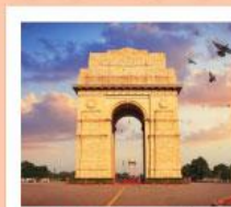
♥♥♥ India Gate