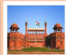
♥♥♥ Agra Fort