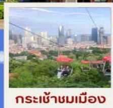
กระเช้าชมเมือง