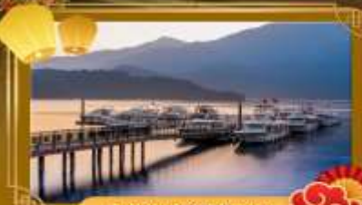
ทะเลสาบสุริยอินจินทรา