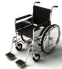
การรับรถดูแลเป็นพิเศษ

กรณีผู้เดินทางต้องการความช่วยเหลือเป็นพิเศษ อาทิเช่น การใช้วีลแชร์ กรุณาแจ้งบริษัทฯ อย่างน้อย 7 วันก่อนการเดินทาง มิฉะนั้นบริษัทฯ จะไม่สามารถจัดการล่วงหน้าได้ เนื่องจากการขอใช้วีลแชร์ในสนามบินนั้น ต้องมีขั้นตอนในการขอล่วงหน้า และบางสายการบินอาจมีการเรียกเก็บค่าใช้จ่ายทั้งทางสนามบินไทยและในต่างประเทศ ซึ่งผู้เดินทางสามารถสอบถามกับเจ้าหน้าที่ได้โดยตรงก่อนทำการจอง และหากในขณะของท่านมีผู้ต้องการดูแลพิเศษ เช่น ผู้ที่นั่งรถเข็น (Wheelchair), เด็ก, ผู้สูงอายุและผู้ที่มีโรคประจำตัวหรือไม่สะดวกในการเดินทางท่องเที่ยวในระยะเวลาเกินกว่า 4 - 5 ชั่วโมงติดต่อกัน ท่านและครอบครัวต้องให้การดูแลสมาชิกภายในครอบครัวของท่านเอง เนื่องจากการเดินทางเป็นหมู่คณะ หัวหน้าทัวร์มีความจำเป็นต้องดูแลคณะทัวร์ทั้งหมด