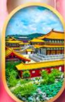
เมืองจำลองสามก๊ก