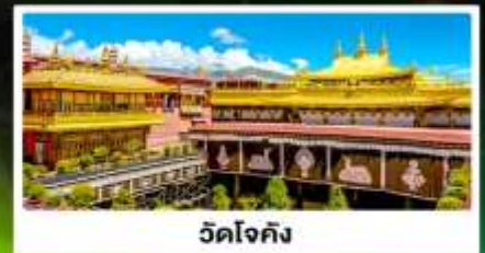
วัดโจกิง