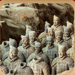
“สุสานจีนซีฮ่องเต้”

ชมถ้ำหลงเหมิน มรดกโลกที่เมืองลั่วหยาง • สุสานจีนซีฮ่องเต้ • ศาลเจ้ากวนอู วัดเส้าหลิน + ป่าเจดีย์ + ชมโชว์กังฟู • เมืองโบราณลั่วอี้ • อุทยานหยุนไท่ซาน เจดีย์ห่านป่าใหญ่ • ถนนวัฒนธรรมต้าถัง • ถนนคนเดินอิสลาม • จัตุรัสหอระฆัง