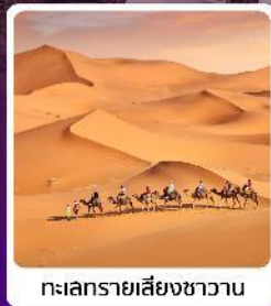
ทะเลทรายสีงชาวน