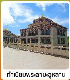
ทำเนียบพระลามะอูหลาน