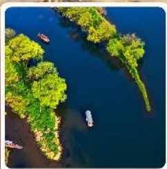
อ่าวพระจันทร์