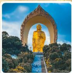
พระใหญ่ตงหลิน