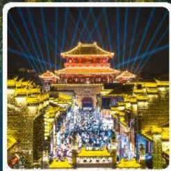
เมืองโบราณเซียงหยาง