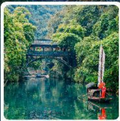
หมู่บ้านชาเมี่ยหมื่นเจีย