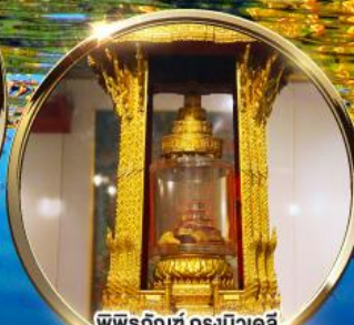
พิพิธภัณฑ์ กรุงนิวเดลี กราบมัสการพระบรมสารีริกธาตุ