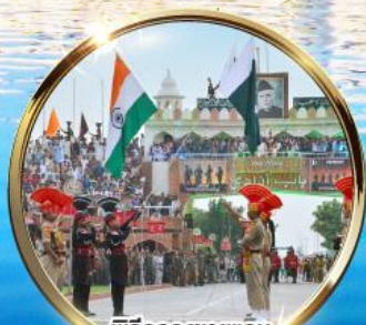
ฟรีลดธงชายแดน อินเดีย-ปากีสถาน ผ่านวากาห์