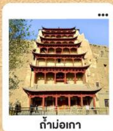
ต้าม่อเกา