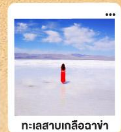
ทะเลสาบเกลือฉาซ่า