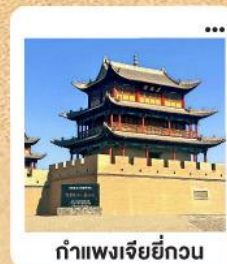
กำแพงเจียยี่กวน