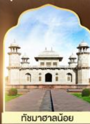
ถ้ำมาฆาลน้อย