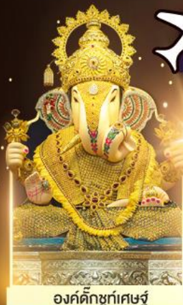
องค์ตั้งบูทพิเศษ