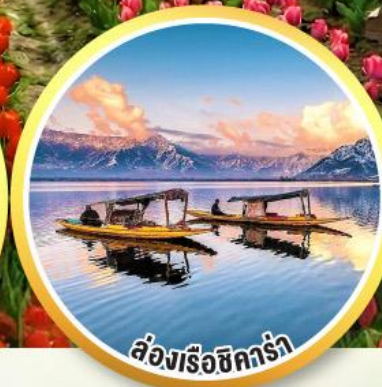
ล่องเรือชิคร่า