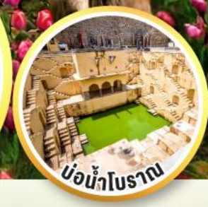
บ่อน้ำโบราณ