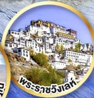
พระราชวังเลห์