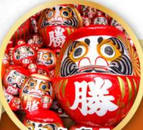
วัดคัตสึโงจิ (วัดดามะ)

ชมความงามของกำแพงหิมะ เส้นทางสายอัลไพน์ ทากายามา (JAPAN ALPS SNOW WALL)