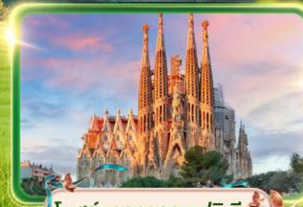
โบสถ์ซากราดา แฟมิลีย