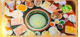
สุกี้เหี้ย