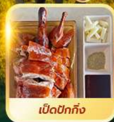
เบ็ดปักกิ้ง