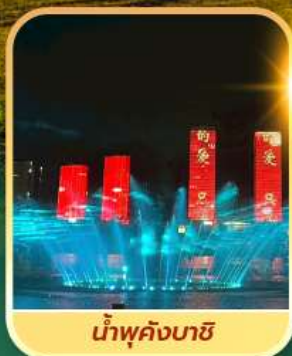
น้ำพุคังบาซี