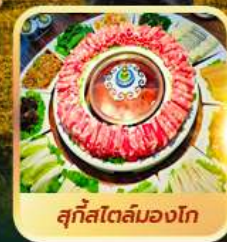
สุกีสโตลมองโก