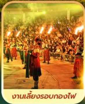
งานเลี้ยงรอบกองไฟ