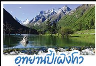
อุทยานปักเฉิงโกว

ภูเขาสี่ดรุณี อุทยานจิวจ้ายโกว นั่งรถไฟความเร็วสูง น้ำพุไม่ไผ่ตักSKP อุทยานปักเฉิงโกว วัดต้าฉือ ถนนโบราณชอยกวางชอยแคบ ช้อปปิ้งถนนไถ่กู่หลี่ + ถนนซุนชี่ลู่