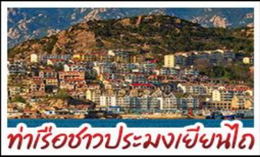
ท่าเรือชาวประมงเยียนโก