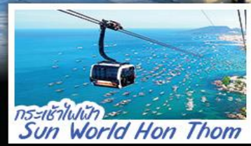
กระเช้าไฟฟ้า Sun World Hon Thom