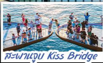
สะพานจูบ Kiss Bridge