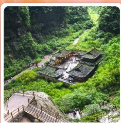
หลุมบ่อฟ้า