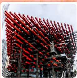
ตึกตะเกียบ