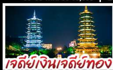
เจดีย์เงินเจดีย์ทอง

ล่องแพไม้ไผ่ แม่น้ำหลี่เจียง - ภูเขาห้วย กระเช้า ไปกลับ บ้านบันไดหลงเซิน - เจดีย์เงินเจดีย์ทองวิวห้า นางวงช้าง - บอลลูนชมวิว 360 แม่บุพิศข บุปผ์ตึงย่างบาร์บิคิว ปลาอบเบียร์ ฝัอกคริสตล สุกี่หัด