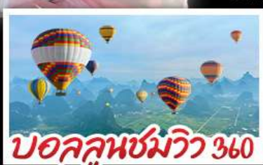
บอลลูนชมวิว 360