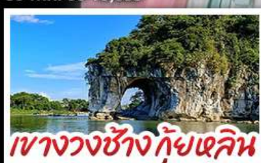
นางวงช้างกัซแลคิน