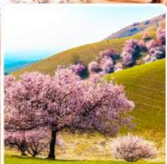
ทุ่งดอกอัลมอนด์