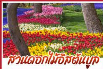
สวนดอกไม้อิสตันบูล