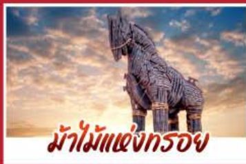
ม้าไม้แห่งกรอย