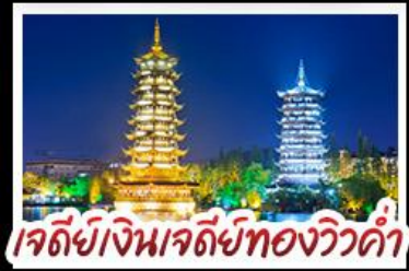
เจดีย์เงินเจดีย์ทองวิวคำ

หมู่บ้านแม้วซีเจียง - เวาหลูอี้ - กุหลาบพันปี เมืองปี้เจีย เวางวงซ้าง - เจดีย์เงินเจดีย์ทองวิวคำ - เวาหลูอี้ ช้อปปิ้งกับถนนคนเดิน ซิซียง - ซีเจียง เมนูพิเศษ บุฟเฟ่ต์ชาบูซีฟู้ด ปลาอบเบียร์ ฝ่อกคริสตัล สุกี้หัด