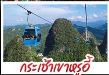
กระเช้าเวาหลูอี้