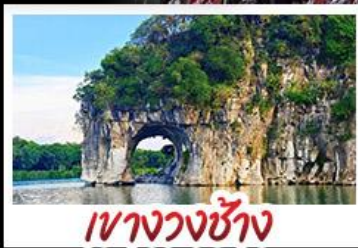
เวางวงซ้าง