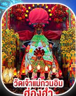
วัดเจ้าแม่กวนอิม ฮ่องฮ่า