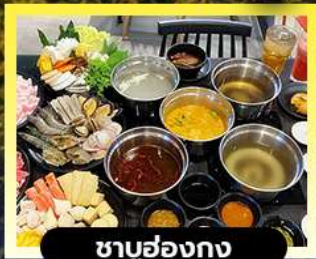
ชาบูฮ่องกง