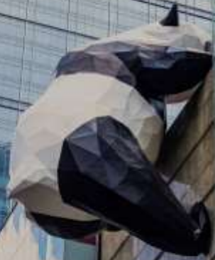
ยานไท่กู่พลี IFS (หมีแพนด้าปีนตึก)

เดินข้ามถนนมาอีกหน่อย ท่านจะได้ซื้อป๊อง ถนนคนเดินชุนซีอู่ (Chunxi Road) เต็มไปด้วยร้านค้าแบรนด์ชั้นนำทั้งในและต่างประเทศ รวมถึงร้านเสื้อผ้าแฟชั่น รองเท้า อุปกรณ์อิเล็กทรอนิกส์ และของฝาก ถนนคนเดินชุนซีอู่เป็นจุดที่มีความคึกคักและเต็มไปด้วยผู้คน โดยเฉพาะในช่วงวันหยุดสุดสัปดาห์และเทศกาลต่างๆ คุณจะได้พบกับการแสดงศิลปะการแสดงดนตรี และกิจกรรมที่น่าสนใจ มีร้านอาหารมากมายที่เสิร์ฟอาหารท้องถิ่นและขนมหวานที่หลากหลาย นักท่องเที่ยวสามารถลิ้มลองเมนูพื้นเมืองที่อร่อย เช่น เสี่ยวหลงเปา (ซาลาเปานึ่ง) หรือขนมโบราณตามรอยซีรีส์จีนอย่าง มาโลโกว ก็มีเช่นกัน