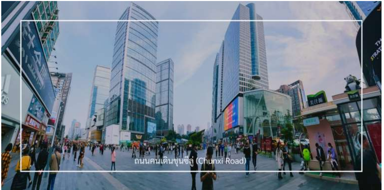
ถนนคนเดินชุนซีอู่ (Chunxi Road)

เดินข้ามถนนมาอีกหน่อย ท่านจะได้ซื้อป๊อง ถนนคนเดินชุนซีอู่ (Chunxi Road) เต็มไปด้วยร้านค้าแบรนด์ชั้นนำทั้งในและต่างประเทศ รวมถึงร้านเสื้อผ้าแฟชั่น รองเท้า อุปกรณ์อิเล็กทรอนิกส์ และของฝาก ถนนคนเดินชุนซีอู่เป็นจุดที่มีความคึกคักและเต็มไปด้วยผู้คน โดยเฉพาะในช่วงวันหยุดสุดสัปดาห์และเทศกาลต่างๆ คุณจะได้พบกับการแสดงศิลปะการแสดงดนตรี และกิจกรรมที่น่าสนใจ มีร้านอาหารมากมายที่เสิร์ฟอาหารท้องถิ่นและขนมหวานที่หลากหลาย นักท่องเที่ยวสามารถลิ้มลองเมนูพื้นเมืองที่อร่อย เช่น เสี่ยวหลงเปา (ซาลาเปานึ่ง) หรือขนมโบราณตามรอยซีรีส์จีนอย่าง มาโลโกว ก็มีเช่นกัน