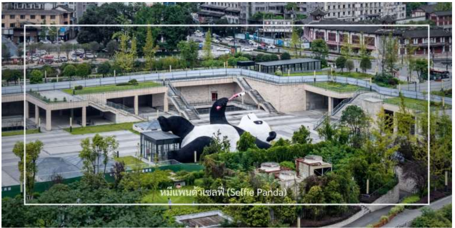
หมีแพนด้าเซลฟี (Selfie Panda)

เที่ยวชม ถนนคนเดินความจำย (ชอยกว้าง-แคบ) (Kuanxiangzi Alley) ถนนโบราณหรือในชื่อภาษาไทยจะถูกแปลออกมาว่า "ถนนชอยกว้างชอยแคบ" โดยมีนัยว่า หากถนนมีความกว้างนั้นหมายถึงพื้นที่สำหรับคนชนชั้นสูง หรือคนมีฐานะ เพราะคนสมัยนั้นโดยสารกันด้วยรถม้านั่นเอง แต่หากเป็นชอยแคบๆ ก็จะเป็นที่พักอาศัยของคนที่มีฐานะปานกลาง ก่อนจะมีการบูรณะให้กลายเป็นแหล่งท่องเที่ยว ถนนคนเดินความจำยเป็นสถานที่ที่มีความคึกคักและมีชีวิตชีวา โดยเฉพาะในช่วงเย็น ที่ผู้คนมักออกมาเดินเล่นและสนุกกับกิจกรรมต่างๆ ถนนนี้เต็มไปด้วยร้านค้า ร้านอาหาร และร้านขายของที่ระลึก นักท่องเที่ยวสามารถเลือกซื้อสินค้าท้องถิ่น เช่น งานหัตถกรรม เสื้อผ้า และของฝากต่างๆ รวมถึงอาหารท้องถิ่นที่อร่อย