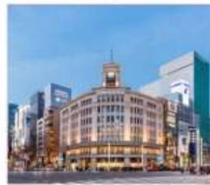
กินซ่า ช้อปปิ้ง