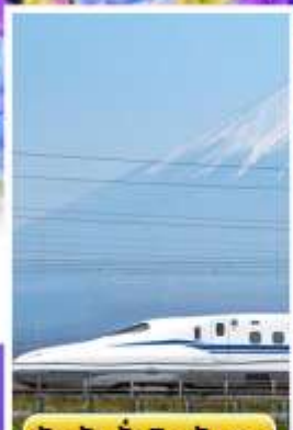
สัมพัสนั่งชินคันเซน