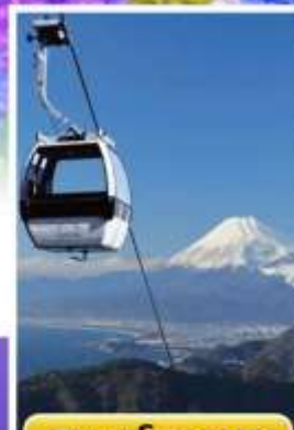
อิซุพานอรามาวิว