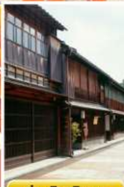
ย่านอิงาชิบายะ