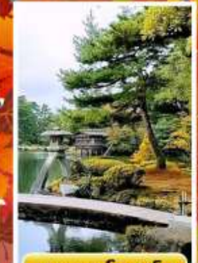
สวนเคนโระคุเอ็น