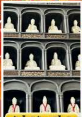
วัดไดชิซังเซอิโดจิ