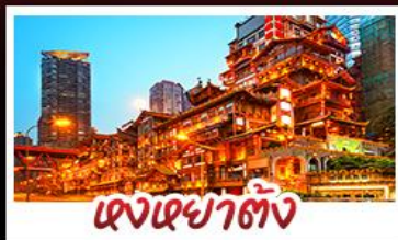
แดงเขาดัง