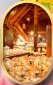
พิพิธภัณฑ์ถ้ำออนเซ็น