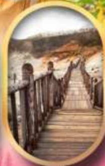
หุบเขาจิทอกุคาบิ