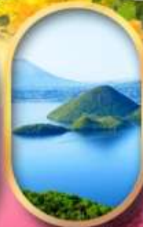
วิวทะเลสาบโทโยะ