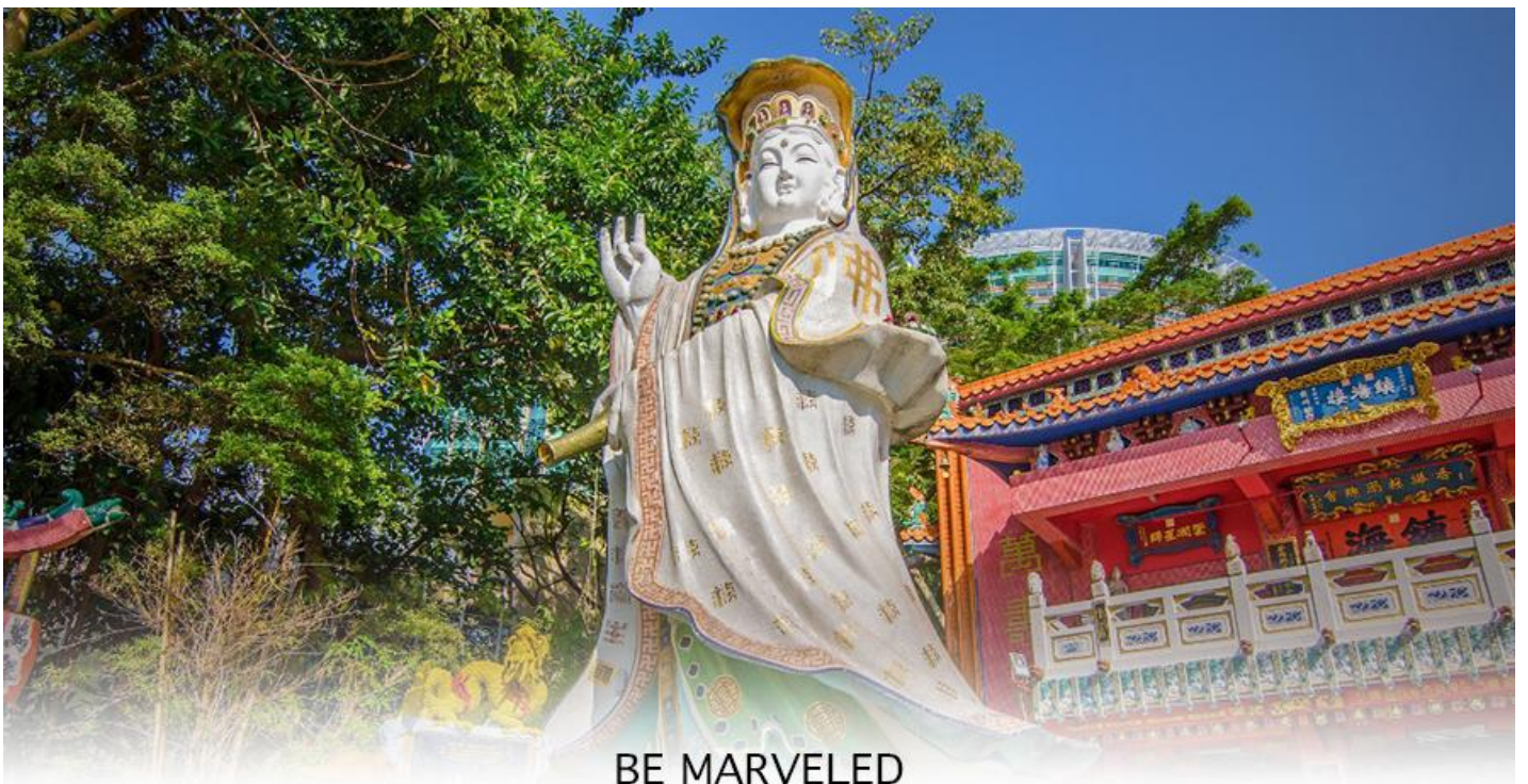
BE MARVELED วัดเจ้าแม่กวนอิมรีพลัสเบย์

จากนั้นนำท่านเดินทางสู่ ชายหาดรีพลัส เบย์ (REPULSE BAY) หาดทรายรูปจันทร์เสี้ยวแห่งนี้เป็นหาดที่สวยงามที่สุดแห่งหนึ่งในฮ่องกง และยังใช้เป็นฉากในการถ่ายทำภาพยนตร์หลายเรื่อง ถือเป็นแหล่งท่องเที่ยวยอดนิยมในหมู่ชาวฮ่องกงนักท่องเที่ยวนิยมมาสักการะที่ วัดทินฮั่ว อารีพลัสเบย์ (TIN HAU TEMPLE REPULSE BAY) ซึ่งตั้งอยู่ริมทะเล เป็นสถานที่ท่องเที่ยวสำคัญ สร้างขึ้นในปี ค.ศ.1993 มีรูปปั้นของ เจ้าแม่กวนอิม ปางประทานพรตั้งอยู่ ซึ่งคนฮ่องกงและคนจีนให้ความเคารพนับถือมากที่สุด เชื่อว่าเป็นเทพที่มีความศักดิ์มากขอพรเรื่องงานการเงิน และขอพรขอโชคลาภเพื่อเป็นสิริมงคลและขอพร