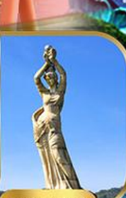
จูไห่ฟิชเชอร์ทิสรา