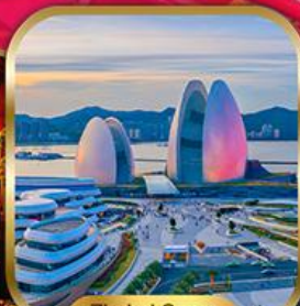
Zhuhai Opera House