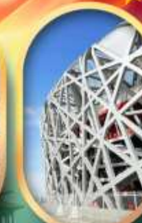
จัสมุตรีสเทียนอันเหมิน