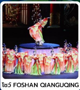
โชว์ FOSHAN QIANGUING