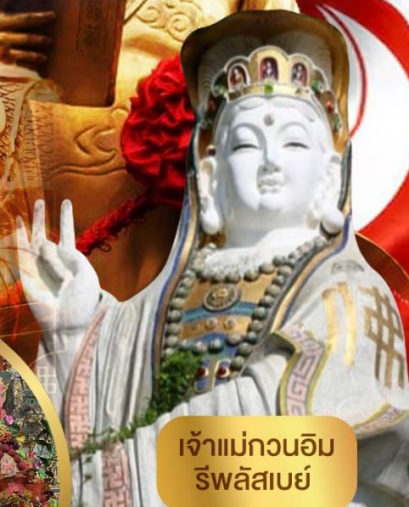
เจ้าแม่กวนอิม ริพลีสเบย์