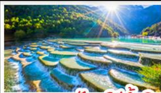
ภูเขาพระจันทร์สีน้ำเงิน

ภูเขาหิมะมังกรหยก - เมืองโบราณแชงกรีล่า วัดลามะซงจันหลิน - รถไฟหิมะภูเขาหิมะมังกรหยก สวนดอกไม้ฮาวามู่ฉาง - เมืองโบราณลี่เจียง ภูเขาพระจันทร์สีน้ำเงิน - เบบูพิเศษ สุกี้ปลาแซลมอน