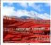
ไร่ชางอีหมว