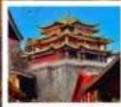
วัดกาม-ซงจ้านหลิง