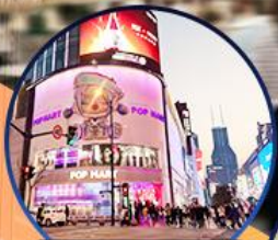
ถนนหนานจิง