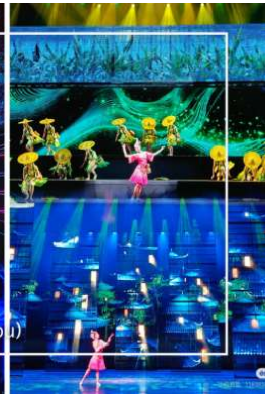
การแสดงโชว์ซีลิ่งคาปู (Xilan Kapu)

เดินทางเข้าโรงแรมที่พัก Xiazhou Hotel ระดับ 4 ดาวหรือเทียบเท่า