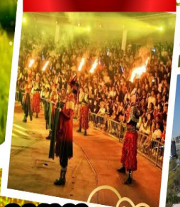
ปาร์ตี้รอบกองไฟ