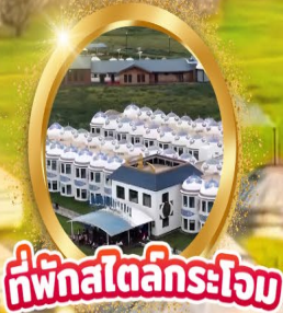
ที่พักสไตล์กระโจม