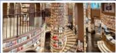
ร้านหนังสือจตุเก๋