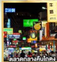
ตลาดกลางคืนโกตง