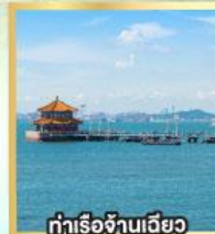
ท่าเรือเจ้านเฉียว