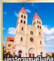
มหาวิหารเซนต์ไมเคิล