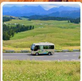
ทุ่งหญ้าเจียนปูลาเค่อ