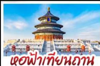
เจดีย์เทียนถาน