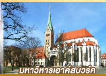
มหาวิหารเอาก์สเวิร์ค