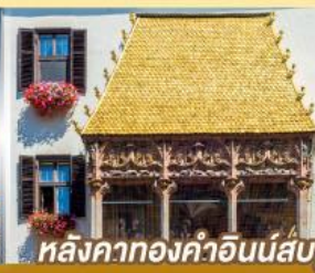
หลังคาทองคำอินน์ส์บรุค